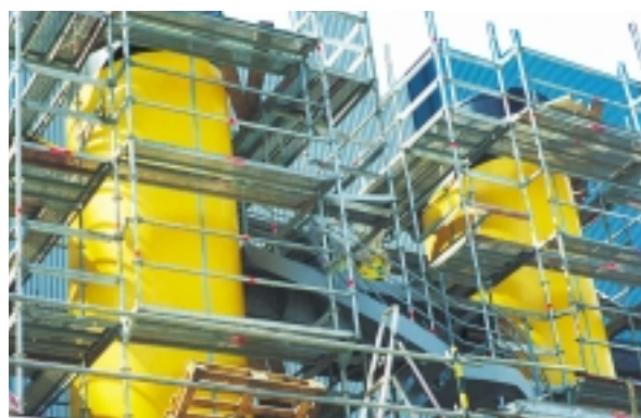
Laivan savupiipun elementit asennuksessa.

Tarvittaessa valmistamme tuotteesta mallikappaleet testausta ja tarkastelua varten.