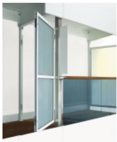
Valmis parvekemuoduli säästää asennusaikaa telakalla.

Komposiittiratkaisut ovat kevyempiä kuin perinteiset rakenteet. Esimerkiksi suunnittelemamme ja valmistamamme kansirakenteet ja parvekekokonaisuudet painavat vain murto-osan perinteisiin rakenteisiin verrattuna.